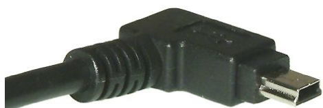
USB Mini B