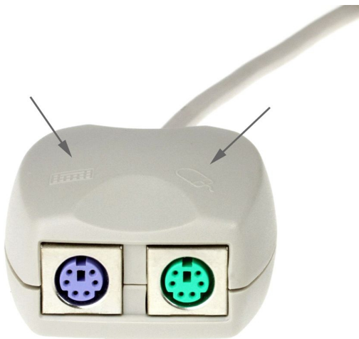
PC 99 Standard (Colors)